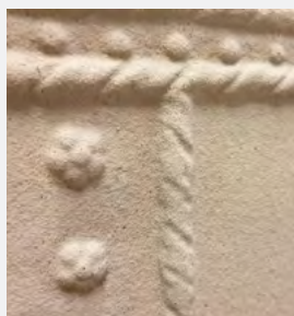
PIERRE DE QUALITÉ