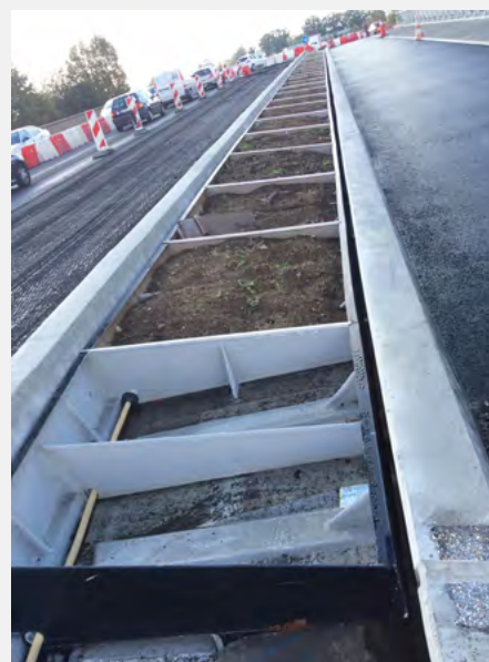
Bac FIVE sur mesure bruts (sans finition) Renforcés - étanchéité complète avec percements