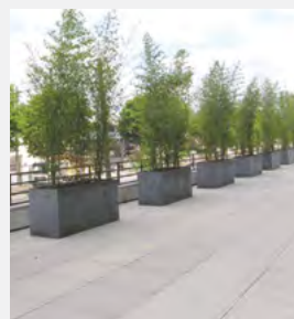
NATUREL PLOMB VIELLI